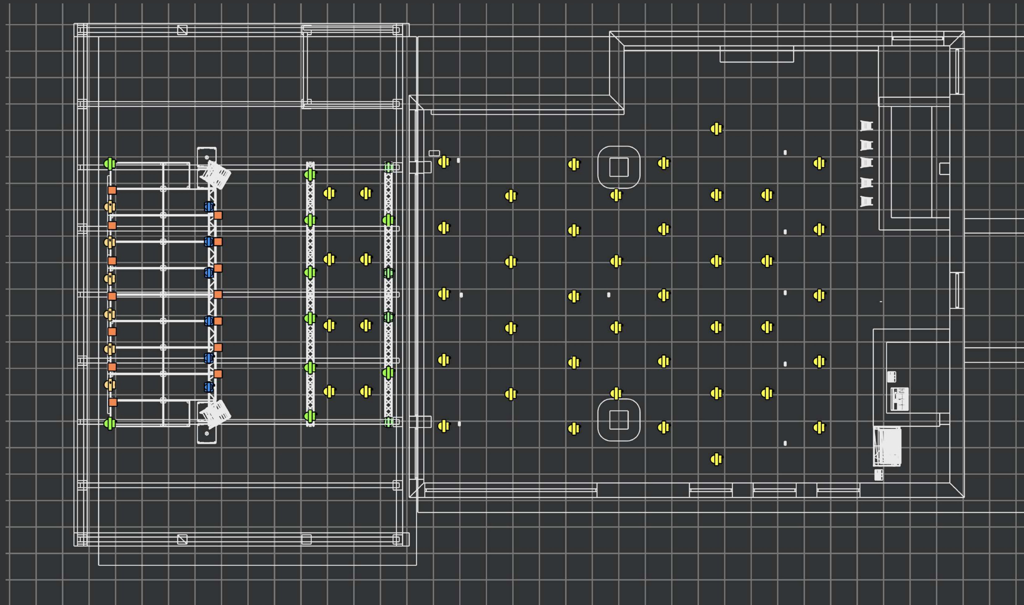
Схема зала «Есенин»